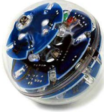
شکل ۱ - نمونه شکل داده شده

قرار دهید. یک نمونه شکل و نمودار در زیر آمده است: (توجه شود که شکل‌ها و نمودارها نیز، همانند جدول‌ها باید در موقعیت وسط‌چین نسبت به طرفین کاغذ و در جداولی با خطوط بی‌رنگ مطابق زیر قرار گیرند.)